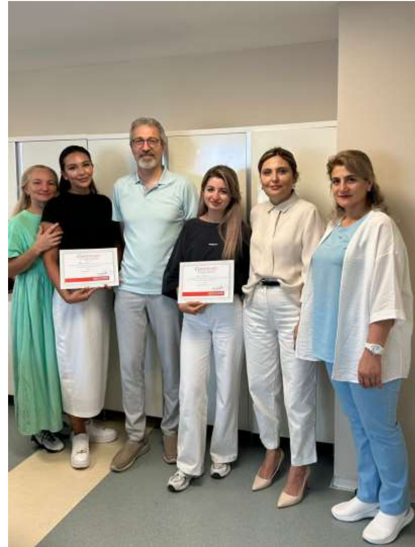
Анталия, Турция, Клиника Medical Park Antalya 2023 год