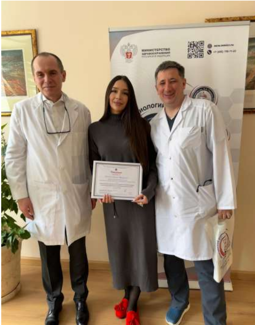
Медицинский радиологический научный центр им. А.Ф. Цыба, 2025 год