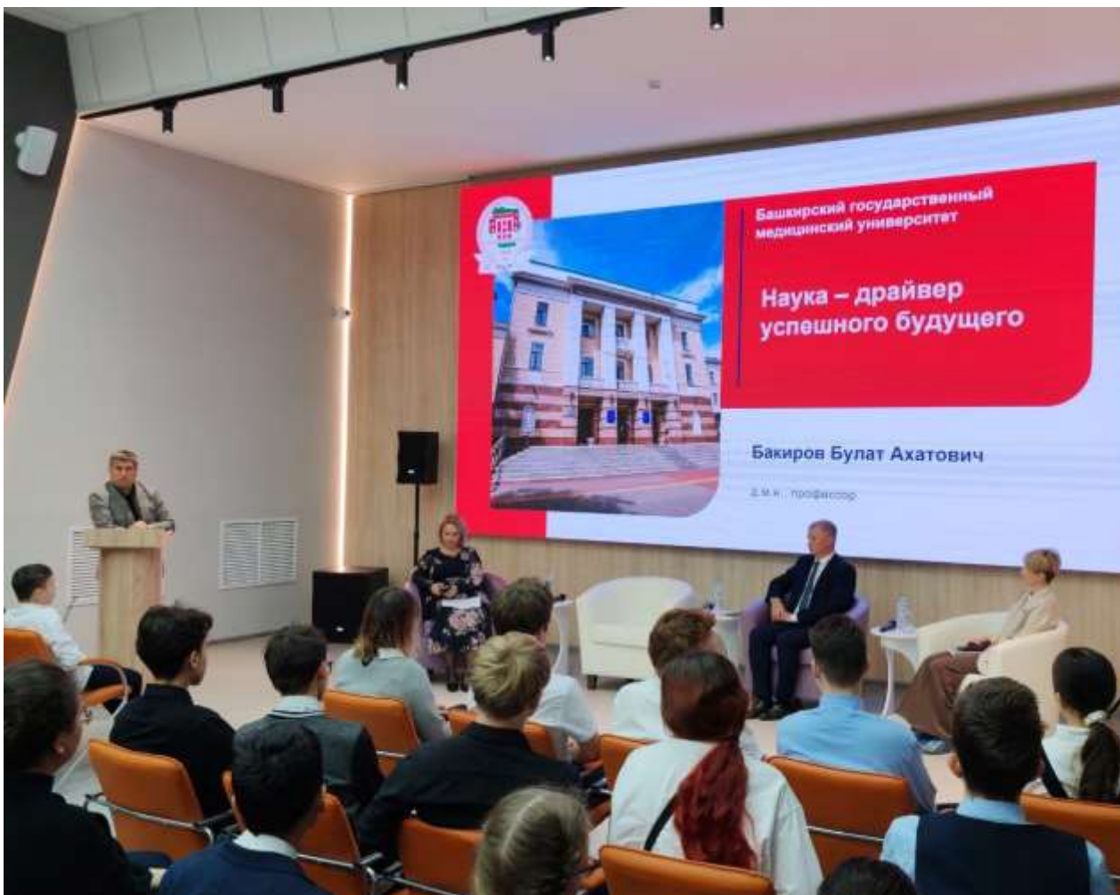
Встречи со школьниками