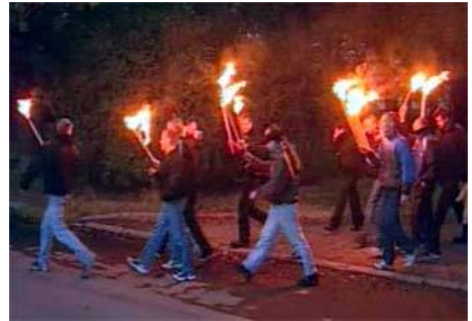
Скинхеды. Факельное шествие в Петербурге.