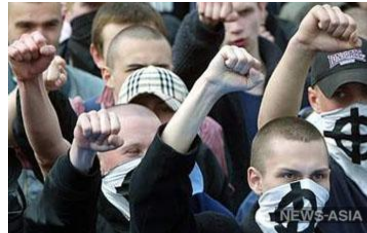
В Костроме скинхеды напали на неформалов