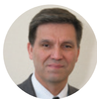
БАКИРОВ АХАТ БАРИЕВИЧ

Ректор ФГБОУ ВО «Санкт-Петербургского государственного педиатрического медицинского университета» (Санкт-Петербург)