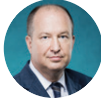
ПАВЛОВ ВАЛЕНТИН НИКОЛАЕВИЧ

Министр здравоохранения Республики Башкортостан (Уфа)