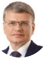
СОЗИНОВ АЛЕКСЕЙ СТАНИСЛАВОВИЧ

Президент ФГБОУ ВО «Самарского государственного медицинского университета», академик РАН (Самара)