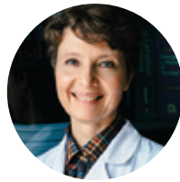
ПАРОВИЧНИКОВА ЕЛЕНА НИКОЛАЕВНА

Главный внештатный терапевт Министерства здравоохранения Республики Башкортостан (Уфа)